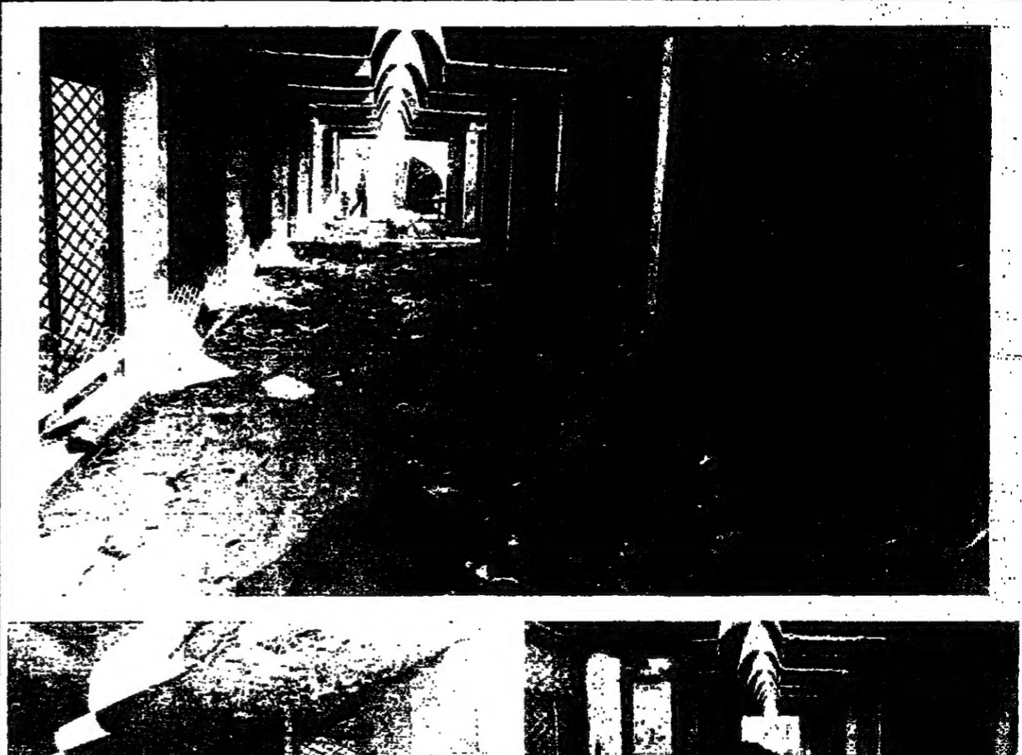
محاولة الحلات التجارية المارمة لصحة التمبر إلى مستودعات لرمي النفايات

وتجدر الإشارة هنا، إلى أنه بين لبنان والكويت، اتفاقية لتبادل المجرمين، صدقت خلال آذار 1964، وهي تتناول مبدأ التسليم والاسترداد، دون أن تتطرق إلى جوهر النصوص التشريعية التي تنظم بهذه القضايا.